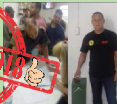
Eleição da CIPA na RODOBAN BH dia 12 de dezembro de 2017