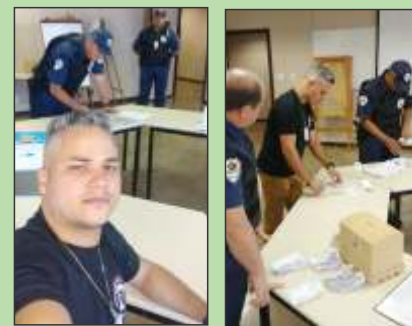
Eleição da CIPA na TRANSFEDERAL BH dia 12 de dezembro de 2017