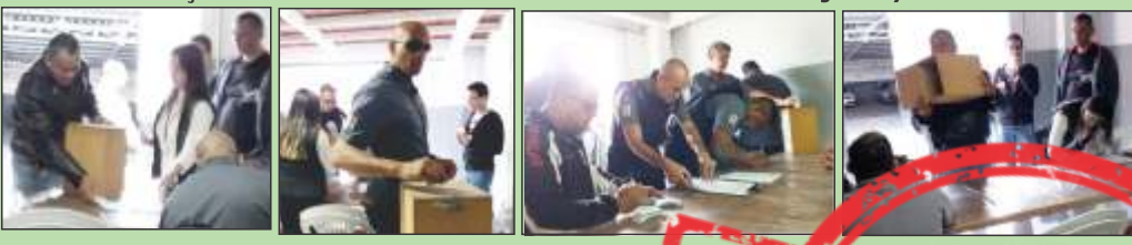
Eleição da CIPA na FIDELYS BH dias 02 e 03 de julho/2018