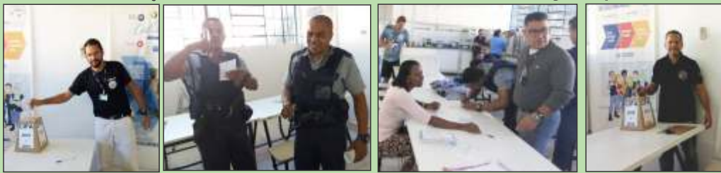
Eleição da CIPA na BRINK'S BH dias 25 e 26 de junho/2018